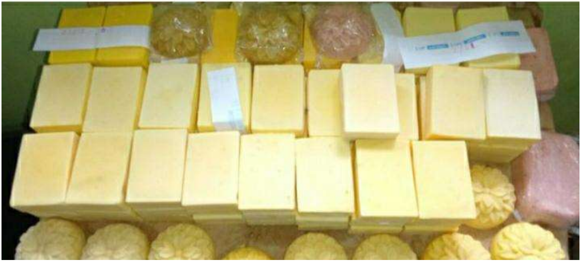
නිර්මලා මහත්මියගේ නිර්මාණ