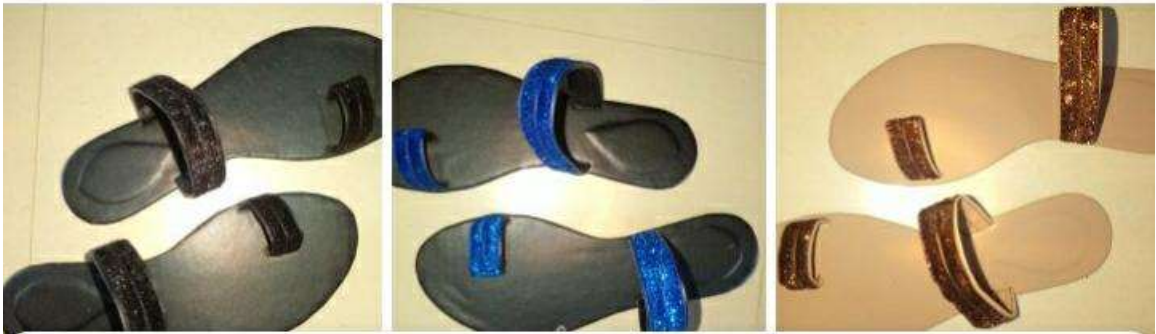
පියුමාලි මහත්මියගේ නිර්මාණ