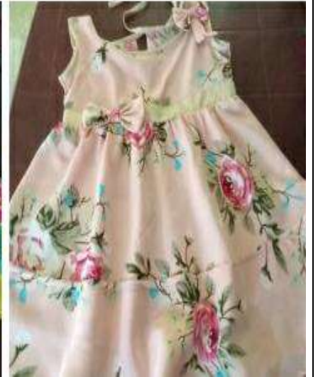
නිර්මලා මහත්මියගේ නිර්මාණ