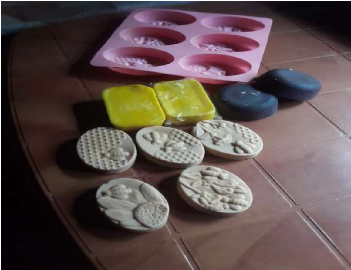
මානෙල් මහත්මියගේ නිර්මාණ

ඇය අපට තවදුරටත් පැවසුවේ අප විසින් සිදුකරන ලද පාඨමාලා ඉහළම මට්ටමකින් තිබුණ නිසාවෙන් ඇය වැනි එවැනි සාර්ථක ව්‍යවසායකයින් බිහි කිරීමට අප ආයතනයට හැකි වූ බවයි. එතුමියගේ ව්‍යාපාර කටයුතු තව තවත් දියුණු කර ගැනීමට උත්සහ කරන බවත් එය ඒ සඳහා අවශ්‍ය කරන වටපිටාව සකසා ගන්න බවත් ඇය වැඩිදුරටත් පවසන ලදී.